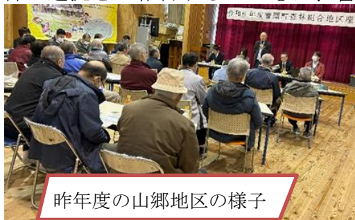
昨年度の山郷地区の様子

今年も「地区座談会」を下記の日程で開催いたします。 組合の近況をご報告するとともに、皆様からのご意見を伺う機会としたいと考えております。