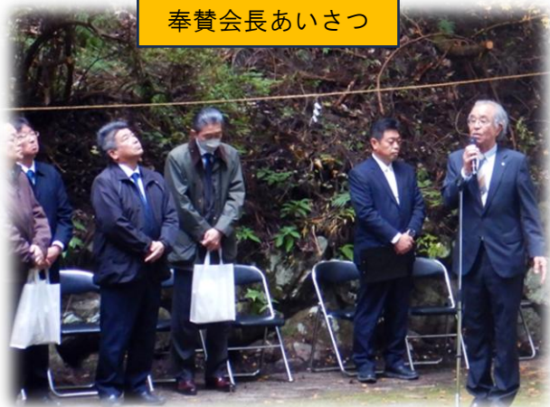
奉賛会長あいさつ