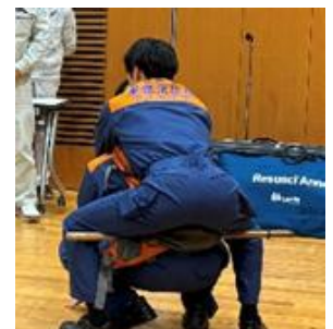
② 棒に足をかけさせ、手を持って搬送