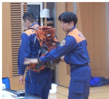
① リュックに棒を差す