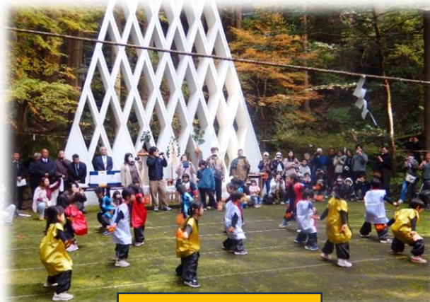
よさこい踊り奉納