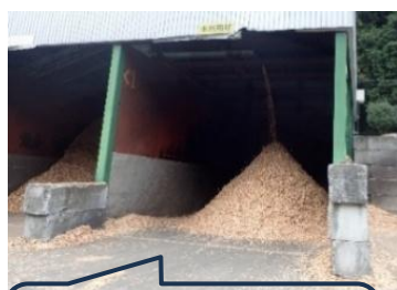
原木から粉碎された チップ

また、女性職員が事務作業を兼務しながら大型車両を運転されている点が非常に印象的でした。